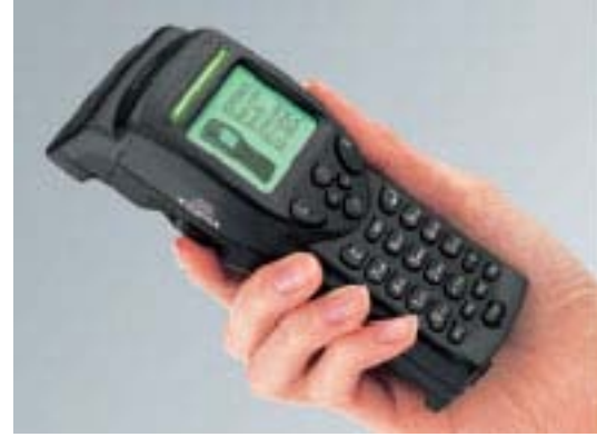
ハンディターミナルに入力

天気、気温、曜日などの条件から売れ筋商品の製造個数を予測 儲けるための製造個数を廃棄ロス率から算出 単品商品の販売数、残数、原価率、粗利率、実粗利金額の把握 カテゴリー別各種分析